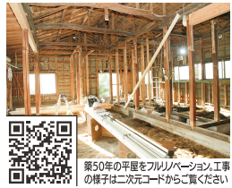
築50年の平屋をフルリノベーション。工事の様子は二次元コードからご覧ください

「このくらいで」と思わずに何でも相談を。また、キッチンや風呂、トイレ、洗面台などのリフォームも任せて安心。その時々のお得な商品も多数用意している。春から初夏にかけては、シロアリ駆除相談も受付中。地元横浜で創業25年目。家の困り事には「不要な工事なし」「しつこい営業なし」「犬が大好き」の同社に相談を。