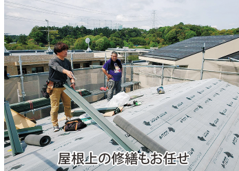
屋根上の修繕もお任せ